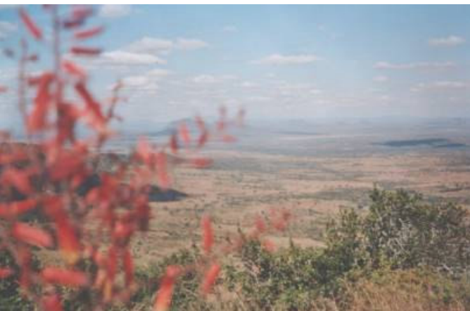
Bild: Maasai Ebene

E: Schon, und alle Stämme haben sich dem untergeordnet, ausser eben uns, den Maasais...(lacht) wir sind besondere Leute, und der Staat lässt uns gewähren; wo gäbe es sonst billiges Rindfleisch zu kaufen?