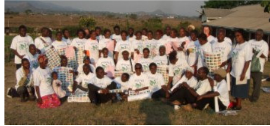
Teilnehmer Gruppe – Seminar 1

Vor ungefähr zehn Jahren war Simbabwe ein Brotkorb und exportierte Weizen und Mais in großen Mengen. Heute ist das Land am Boden zerstört und sogar die Läden sind leer. Diejenigen die können fahren in die Nachbarländer um einzukaufen. Andere sind von ihren kleinen Gärten abhängig. Sie haben wenig zu essen und haben große Angst vor der Zukunft, weil sie weder Samen, Kunstdünger noch Geld dafür besitzen. Die Lehrer streiken, weil ihre Gehälter nicht reichen, auch nicht einmal für ihren Transport zur Arbeit. Eine Krankenschwester sagte mir, in ihrem Krankenhaus gibt es oft Stromausfälle, und nachtsüber gibt es nicht einmal Kerzen. Mit einer Inflationsrate von 50 % pro Tag, können Einheimische ohne Devisen so gut wie nichts kaufen.